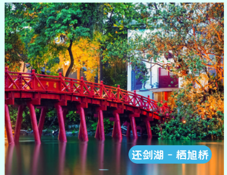
还剑湖 - 栖旭桥